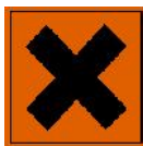
Xn - Nocivo