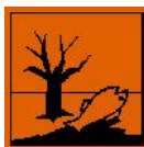
N - Pericoloso per l'ambiente

Frasi R : R20/22 - Nocivo per inalazione e ingestione. R36/37 - Irritante per gli occhi e le vie respiratorie. R48/20/22 - Nocivo: pericolo di gravi danni alla salute in caso di esposizione prolungata per inalazione e ingestione. R50/53 - Altamente tossico per gli organismi acquatici, può provocare a lungo termine effetti negativi per l'ambiente acquatico. Frasi-S : S2 - Conservare fuori della portata dei bambini. S13 - Conservare lontano da alimenti o mangimi e da bevande. S20/21 - Non mangiare, né bere, né fumare durante l'impiego. S29 - Non gettare i residui nelle fognature. S36/37/39 - Usare indumenti protettivi e guanti adatti e proteggersi gli occhi/la faccia. S46 - In caso d'ingestione consultare immediatamente il medico e mostrargli il contenitore o l'etichetta. S60 - Questo materiale e il suo contenitore devono essere smaltiti come rifiuti pericolosi. S61 - Non disperdere nell'ambiente. Riferirsi alle istruzioni speciali/schede informative in materia di sicurezza.